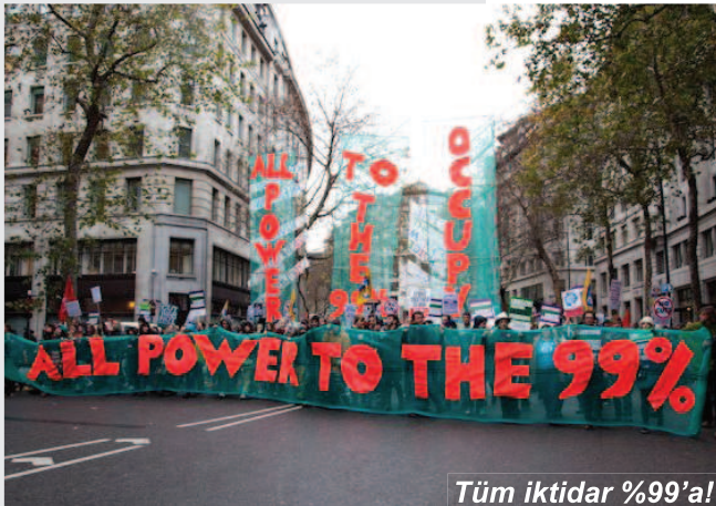
Tüm iktidar %99'a!

30 Kasım günü, Britanya işçi sınıfı, 1926'dan beri en büyük genel grevi gerçekleştirerek, kemer sıkma politikalarına, sağlığın ve eğitimin özelleştirmesine ve gençlerin işsizliğe mahkûm edilmesine karşı genel greve çıktı. Ülke çapında üç milyona yakın kamu çalışanı greve katıldı ve 30 Haziran'dan sonra bu yıl içindeki ikinci genel grev gerçekleştirildi. Sokaklarda on binlerce genç ve işçi kol kola yürüdü. Şimdi Britanya'da özel sektörü de kapsayan daha büyük bir genel grev örgütlenmesi ana tartışma konusu. İzlanda, İrlanda, Portekiz, Yunanistan, İspanya ve İtalya'da zaten uzun süredir büyük ve etkili eylemler düzenleniyordu. Anlaşılan Britanya da bu kervana katılacak. Şimdi sırada krizin bir diğer hedefi Fransa var..! İsyen dalgası yakında oralara da sıçrar.