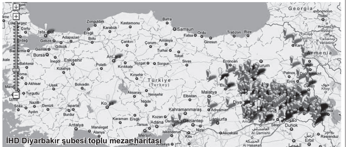
IHD Diyarbakır şubesi toplu mezar haritası

23, yazıyla yirmi üç kafatası ve daha şimdiden! İşin tuhafı, bu kazılara, belli ki ortaya çıkan rakamın çok ürkütücü olması nedeniyle, kazıda çalışan işçilerin "sağlık problemleri" bahanesi ile üçüncü gününde ara verildi. Kendi halkının evlatlarını çıkarmak isteyen yeni işçi bulma sıkıntısı yaşanması, -hem de Amed'de- imkânsız olduğuna göre, sakın bu arada daha büyük infial yaratacak yeni kafataslarını ortadan kaldırmak için olmasın? O bölgenin devlet güçleri dışında; ailelerin, kayıp yakınlarının,