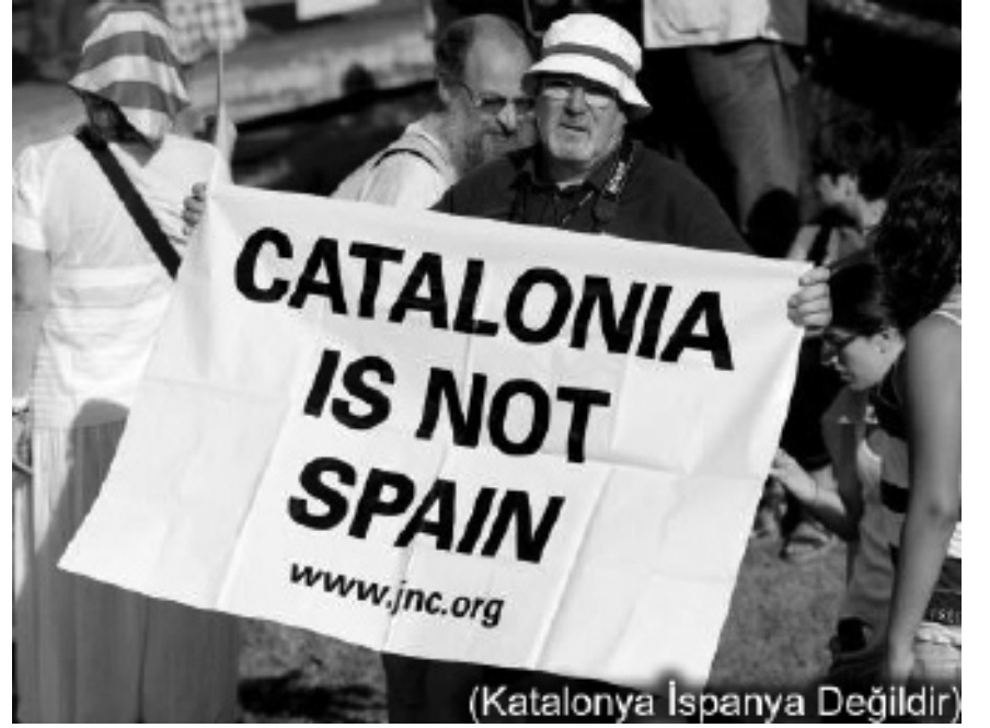
(Katalonya İspanya Değildir)

İsrarla "biz İspanyol değiliz, Katalanız" diyen insanlara ikide bir "İspanyollar" demek biraz tuhaf kaçmıyor mu? "İspanyollar şöyle yaptı, böyle etti" yerine "İspanya" ya da "İspanya takımı" demek bu kadar mı zor? Talihin cilvesi. Final maçından bir gün önce Barcelona sokaklarını dolduran bir milyon Katalan, İspanya'nın Anayasa Mahkemesi'nin bir kararını protesto ediyordu. Ortak slogan "biz bir ulusuz!" idi. Bağımsızlık pankartları da dev gibiydi. Gazete de mi okumuyorlar, televizyon da mı seyretmiyorlar?