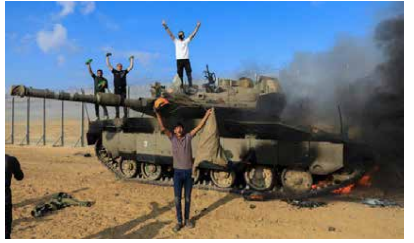
İsrail yenilmez armada mı?

Tüm bunların sonucu, Filistin direniş örgütlerinin El Aksa Tufanı oldu!