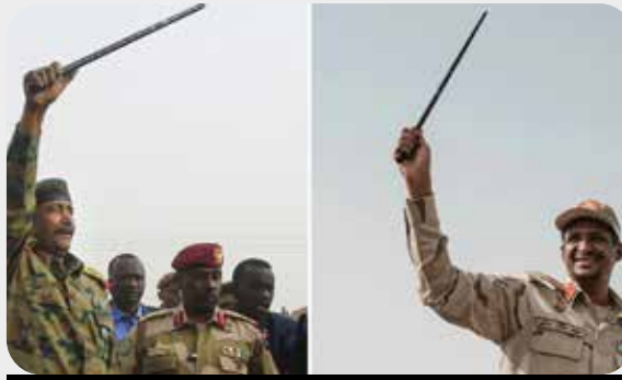
Solda Abdülfettah el Burhan, sağda Muhammed Hamdan Dagalo

hüviyetinde. Bir süredir de Çevik Destek Güçleri'nin Sudan ordusuna katılması için müzakereler yürütülüyor, fakat Hamidi buna ayak dırıyordu. Böylesine bir çatışmanın her an başlayabileceği, silahlar patlamaya başlamadan önce dahi, Sudan siyasetini takip edenlerce