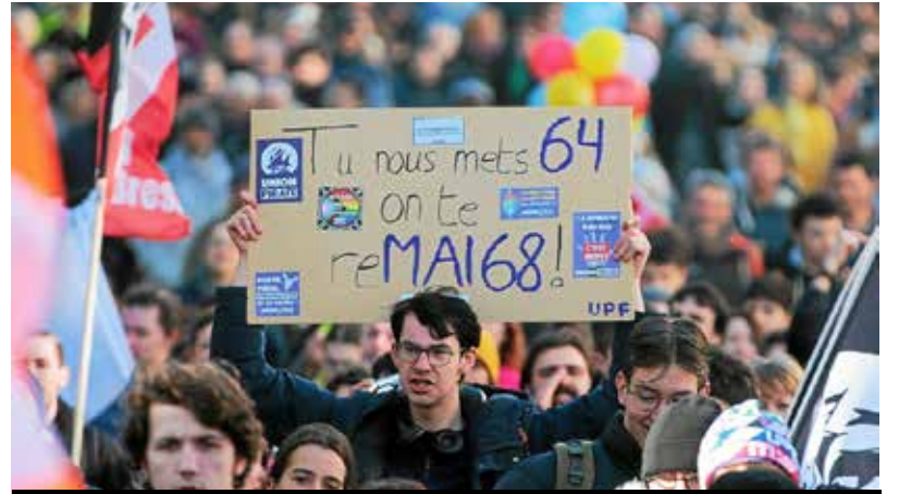
Emeklilik yaşının 64'e çıkarılmasına karşı gençler eylemlerde, 68 Mayıs'ına gönderme ile "sen bize 64'ü dayatıyorsun, biz de sana yeniden Mayıs 68'le karşılık veririz" yazılı dövizler taşıdı.

Fransa'daki gelişmelerden haberdar olmak, isyan eden Fransa işçisi ve gençliği ile duygudaşlık içinde olmak elbette önemli; ancak bu sadece farklı coğrafyalarda benzer mücadeleleri veren kitlelerin duygudaşlığı değil. Bizleri birbirimize bağlayan çok daha somut gerçeklikler var. Macron'un ne olduğu yeni anlaşılmalı, Fransa halkı ve özellikle işçiler ve gençler bunu