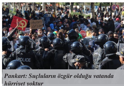
Pankart: Suçluların özgür olduğu vatanda hürriyet yoktur

Sonuç olarak Amerika'da olduğu gibi Tunus'ta da politikayı sokağa taşımaya girişen gerici güçlere hak ettikleri cevap ancak sokakta verilecektir.