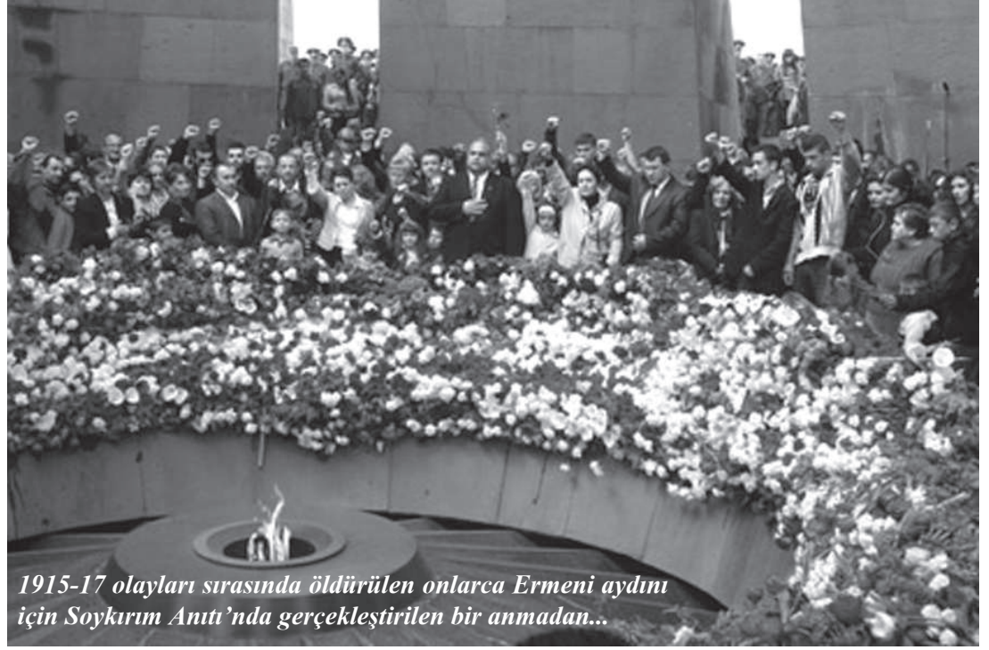
1915-17 olayları sırasında öldürülen onlarca Ermeni aydını için Soykırım Anıtı’nda gerçekleştirilen bir anmadan...

Tüm diğer konular gibi Ermeni sorununun çözümü de, meseleyi tamamen kendi ekonomik ve siyasi çıkarları doğrultusunda çekiştiren emperyalist ve kapitalist devletlere bırakılmaz. Bu konuyu resmi yaklaşımlardan arındırıp tarihi ve siyasi gerçekler temelinde açıklığa kavuşturmak işçi sınıfının ve tüm ezilen kesimlerin boynunun borcudur. “Sözde” değil özde kardeşliğin gereğidir bu.