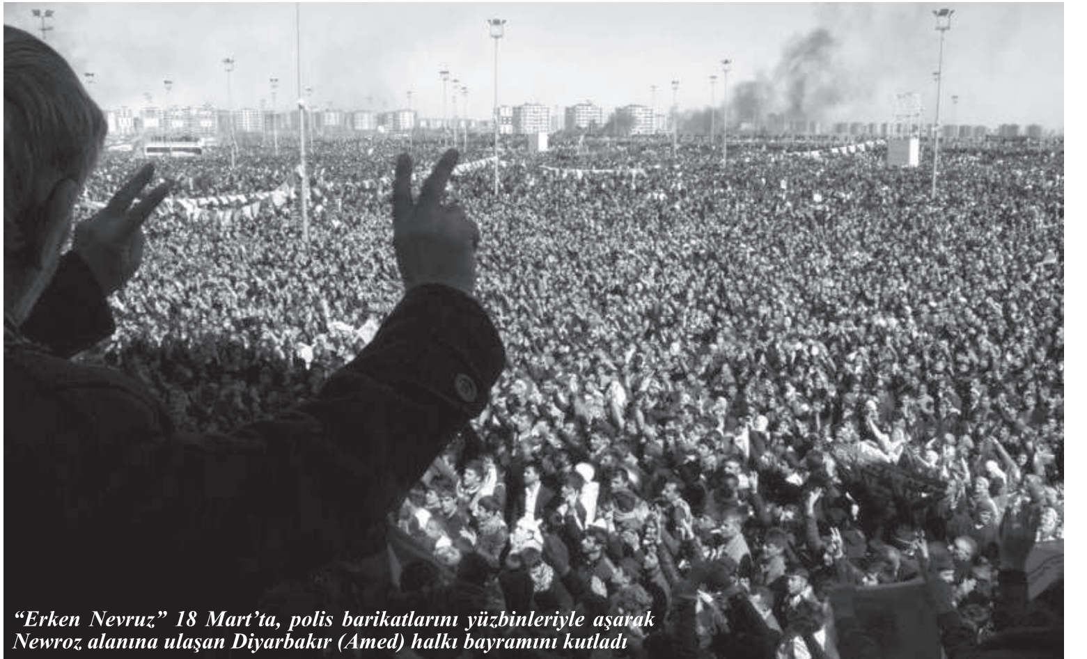
"Erken Nevruz" 18 Mart'ta, polis barikatlarını yüzbinleriyle aşarak Newroz alanına ulaşan Diyarbakır (Amed) halkı bayramını kutladı

Ama bu kadar yıldan sonra Barzani'nin sorunu böyle kolayca çözmesini beklemenin çocukça olduğu ortada. Öyleyse, Kürt sorununu çözmeme iradesi beyan edilmiş oluyor. Erdoğan cumhurbaşkanı seçilsin de ne olursa olsun. İki taraftan yüzlerce, binlerce ölüm daha olacaktı. Ne gam!